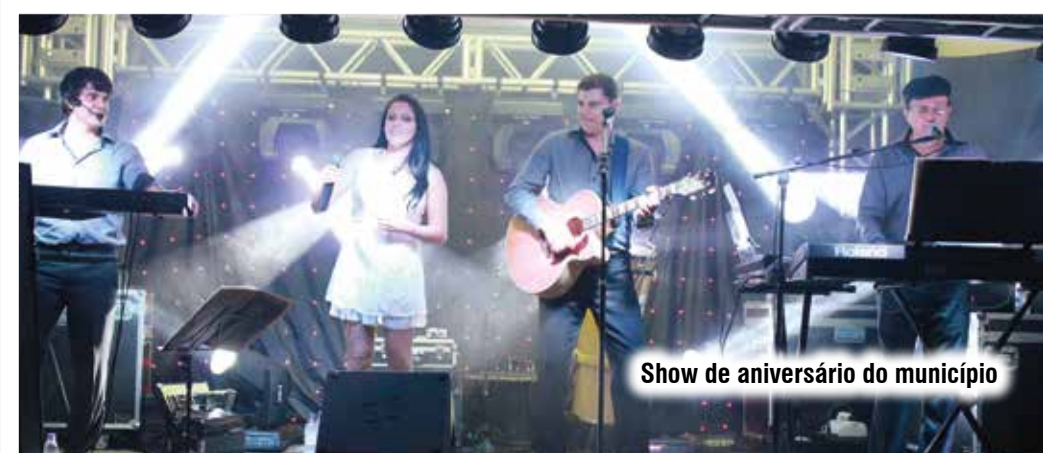
Show de aniversário do município