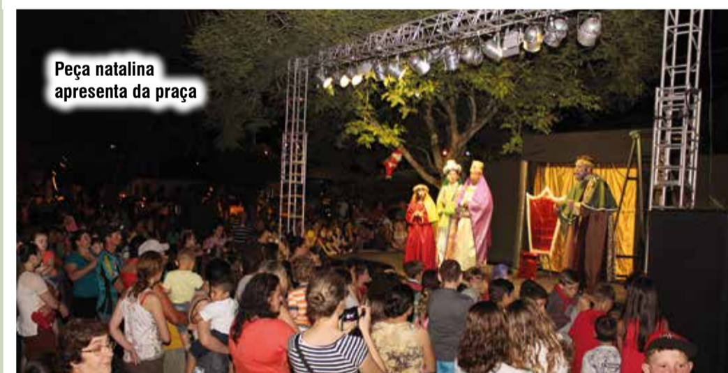
Peça natalina apresenta da praça