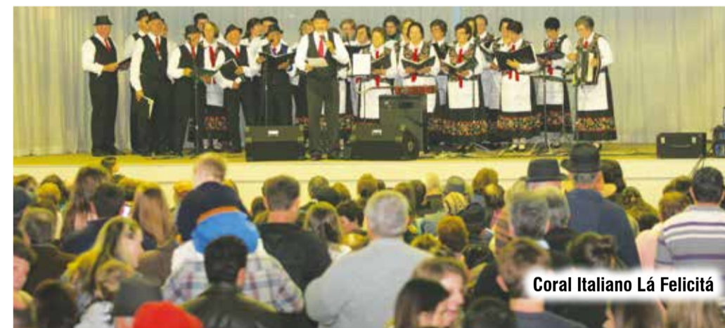
Coral Italiano Lá Felicitá