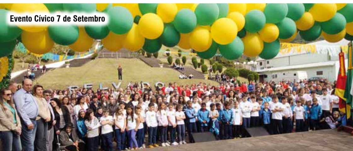
Evento Cívico 7 de Setembro