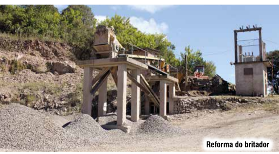
Reforma do britador