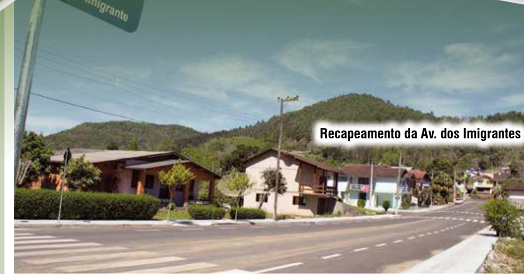
Recapeamento da Av. dos Imigrantes

O Parque Municipal de Eventos contou com investimentos na aquisição de área que foi anexada a existente e construção de nova pista de tiro de laço, somando os investimentos aproximadamente o valor de R$150.000,00.