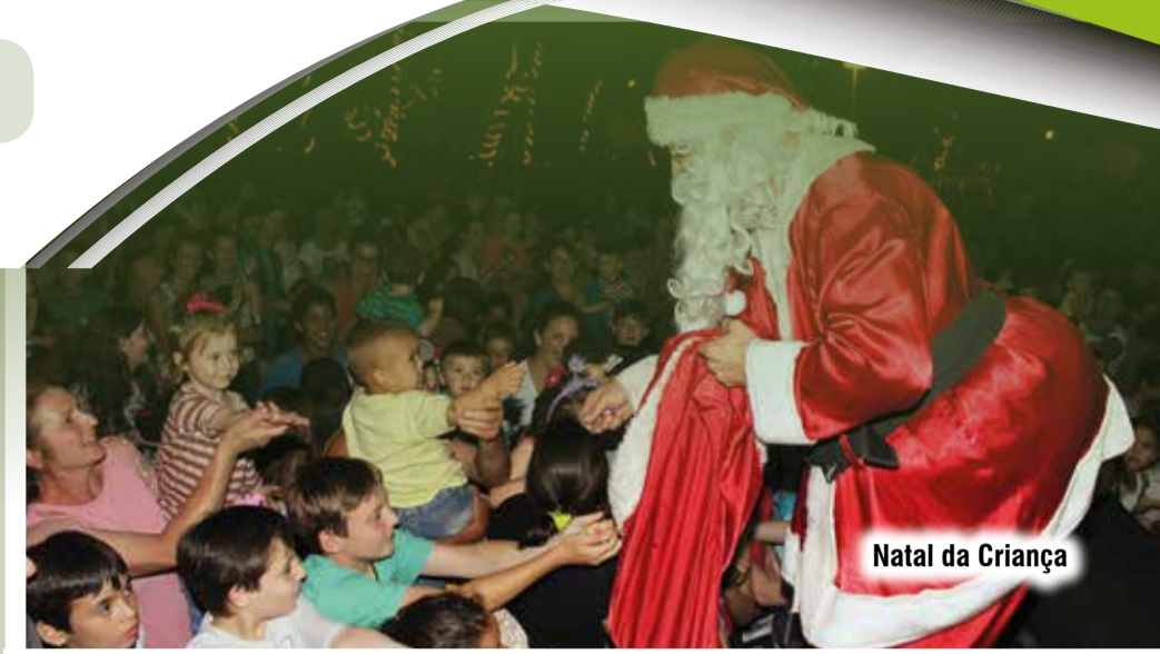
Natal da Criança