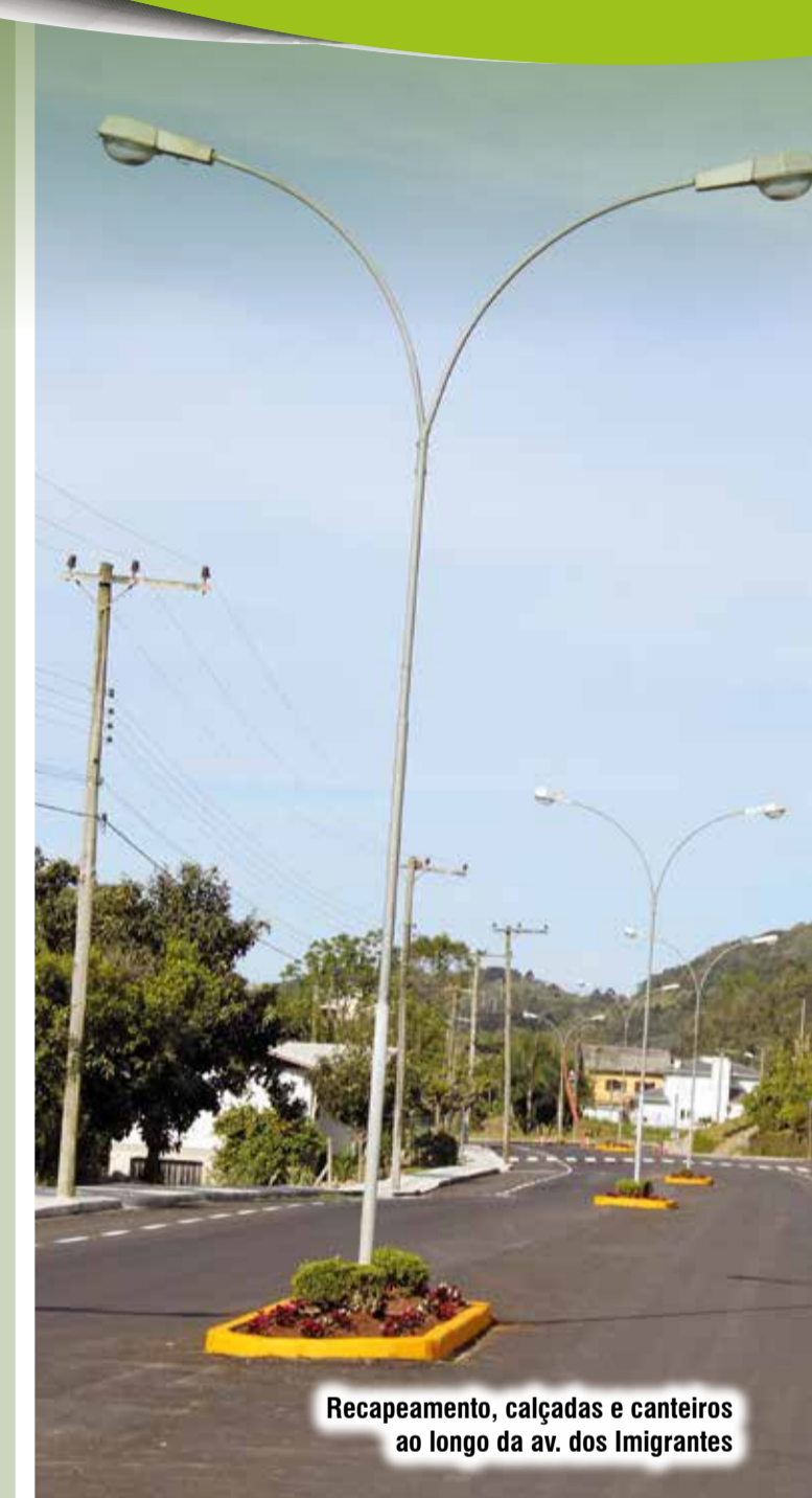
Recapeamento, calçadas e canteiros ao longo da av. dos Imigrantes