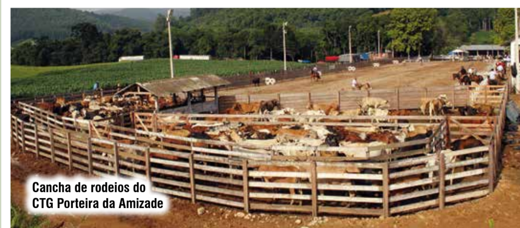
Cancha de rodeios do CTG Porteira da Amizade