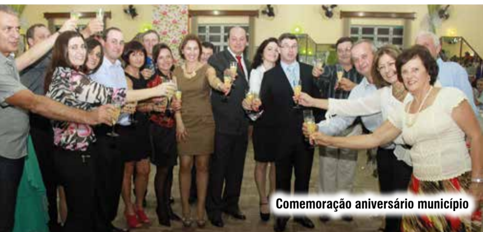
Comemoração aniversário município

No decorrer dos anos são realizados eventos que evidenciam a cultura, a educação, o civismo e o lazer, entre eles destaca-se: as feiras de livros, o filô, as festividades alusivas ao aniversário do município que culmina com um jantar-baile com entrega de premiações, festa do padroeiro, do colono e motorista, de comunidades, semana farroupilha, desfiles cívicos, entre outros que integram a comunidade relvadense.