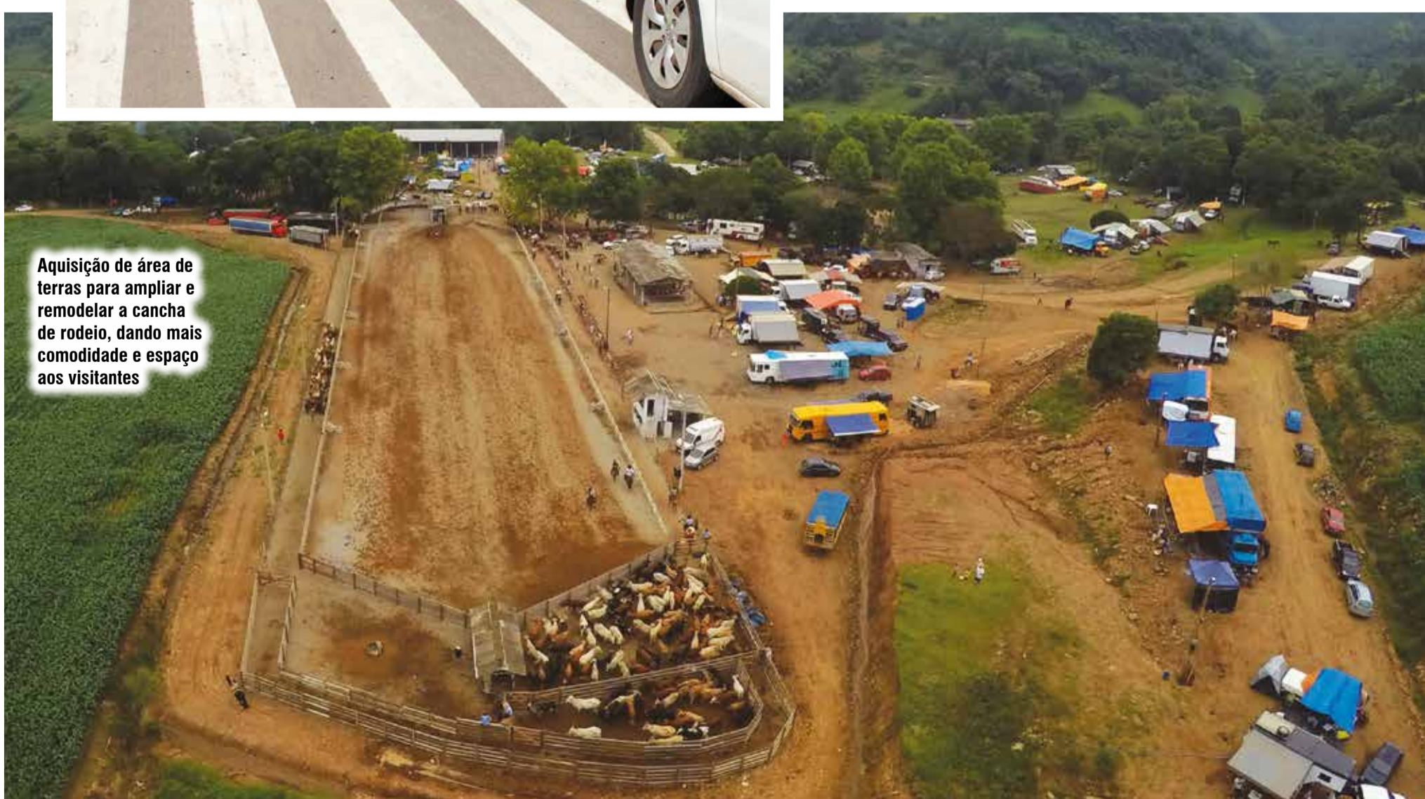
Aquisição de área de terras para ampliar e remodelar a cancha de rodeio, dando mais comodidade e espaço aos visitantes