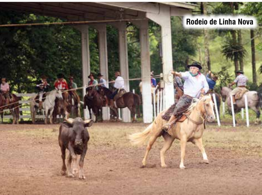
Rodeio de Linha Nova