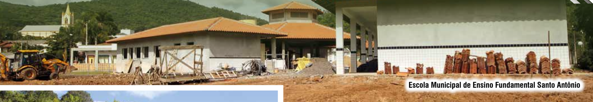
Escola Municipal de Ensino Fundamental Santo Antônio