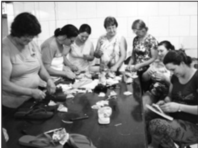
Oficina de Bordado em chinelos com o Clube de Mães de L a Capoeirinhas

No mês de novembro, os clubes de mães realizaram oficinas de artesanato, que foram ministradas pela extesionista da Emater/RS-