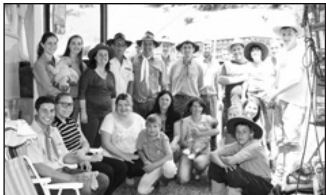
CTG Capitão Ribeiro, do vizinho município de Capitão, no evento