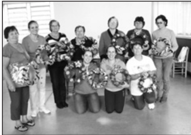
Participantes do Clube de Mães Flor da Serra de Cordilheira com suas Guirlandas de Natal