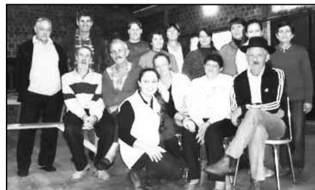
Linha Cristo Rei