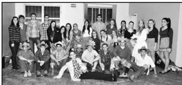
Quadrilha do ensino médio

Na festa caipira Tem pipoca, quentão, bolo, torta, intê pinhão também amendoim qui é bão