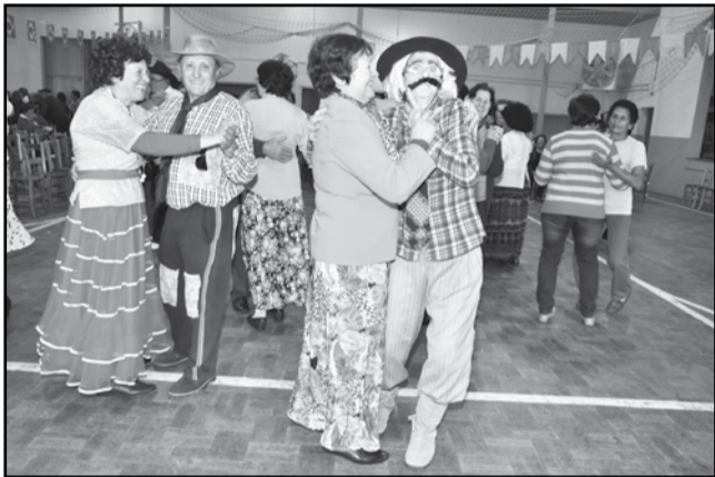
E segue o baile