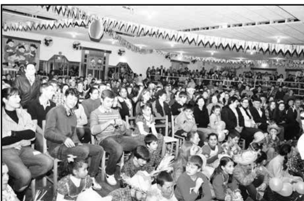
Um grande público se fez presente no Esporte Clube Relvado

A Escola agradece todos os que contribuíram para fazer o sucesso da festa e parabeniza os participantes da quadrilha e do teatro do casamento à caipira pela excelente apresentação.