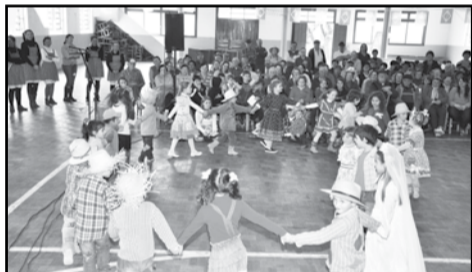
Educação infantil dançando quadrilha