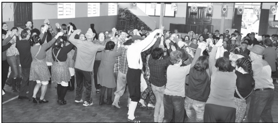
Dança da quadrilha