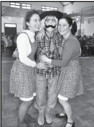
Primeira-dama Andreana e Andrea com integrante do teatro