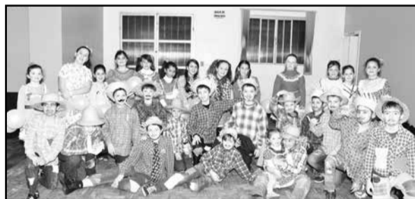
Quadrilha do ensino fundamental

Foi nesse jeito caipira de festejar que muitos relvadenses novamente se divertiram no Arraiá da Plácido dia 27 de junho no Esporte Clube Relvado. A Quadrilha dos alunos de 1ª a 5ª séries empolgou o público, dando início a festa e os atores da cidade fizeram o espetáculo do casamento da Matilde e do Genovevo, provocando boas gargalhadas no público. Não faltou a tradicional comilança preparada pelas funcionárias e professores da Plácido.