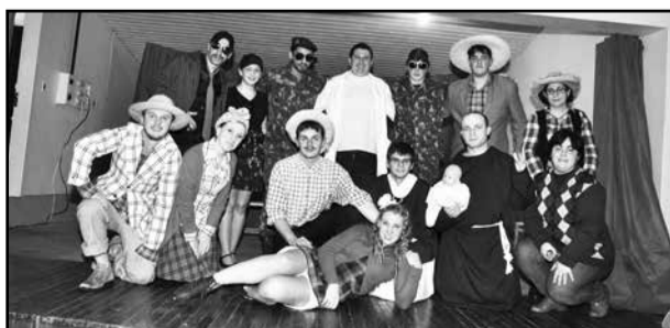
Teatro apresentado pelos alunos