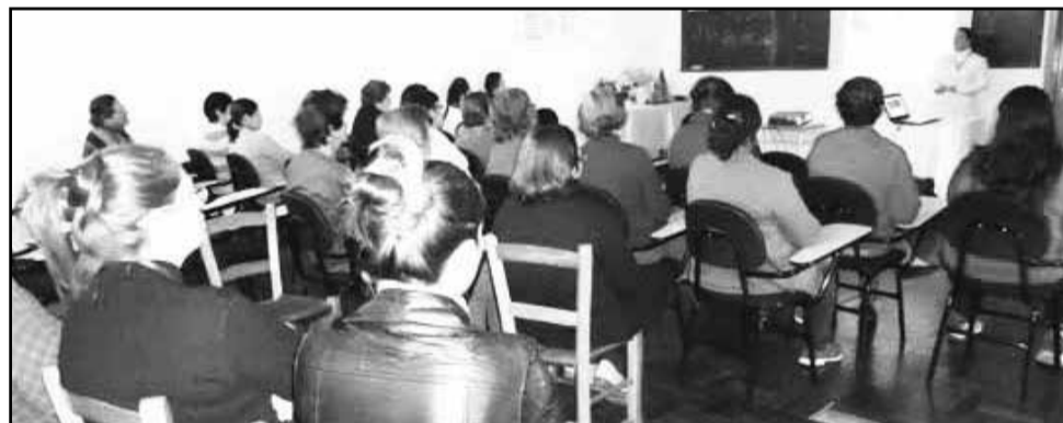
Sala de reuniões na sede