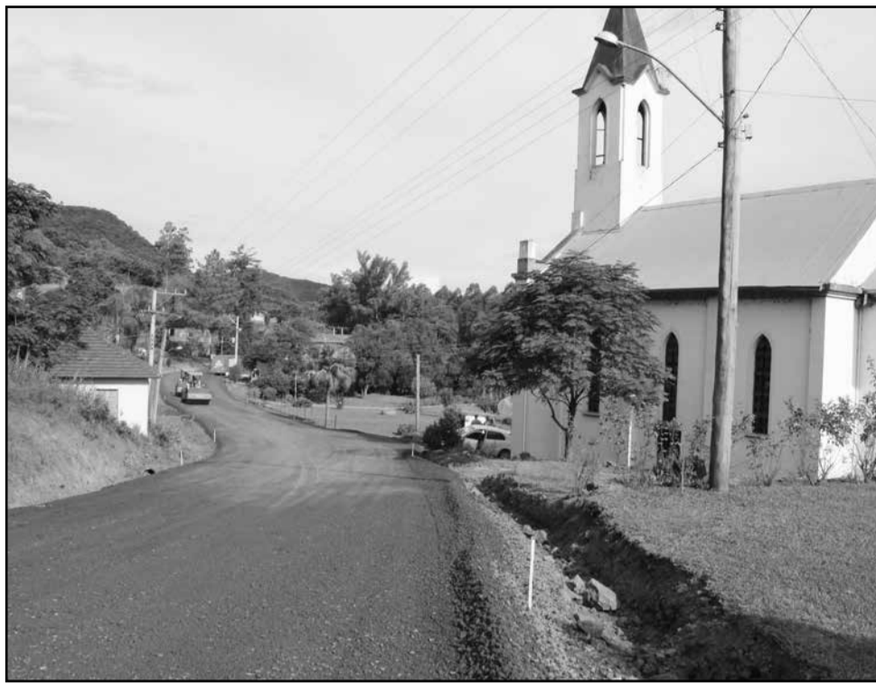
O asfalto está quase concluso, faltando obras de sinalização e drenagem ao lado do rodovia