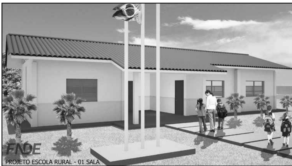
PROJETO ESCOLA RURAL - 01 SALA

A administração municipal de Relvado, com o objetivo de qualificar as escolas rurais, pleiteou junto ao governo federal através do FNDE recursos para a construção de uma escola rural, a qual será construída na Linha Capoeirinhas, atendendo o ensino fundamental. Conforme o projeto arquitetônico do FNDE e plano elaborado