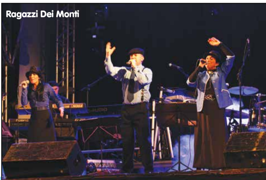
Ragazzi Dei Monti