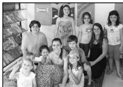
Equipe com alunos e professores da Escola Tiradentes, de Linha Capoeirinhas