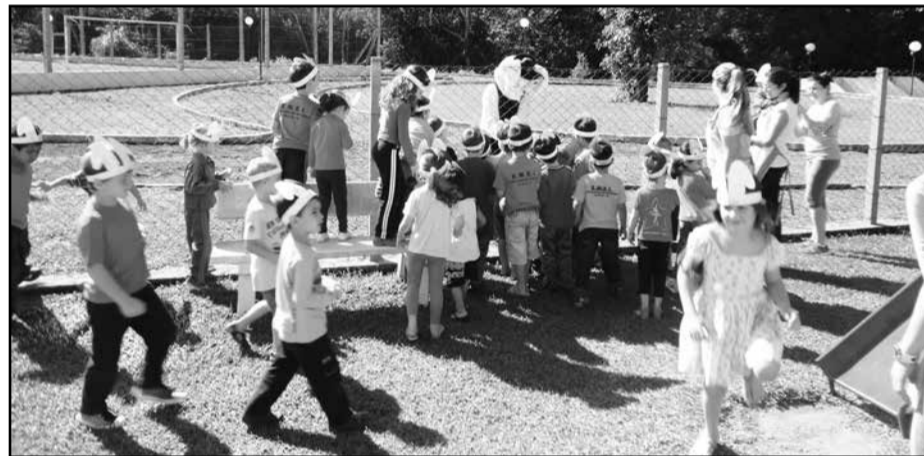
Escola Amiguinhos da Natureza