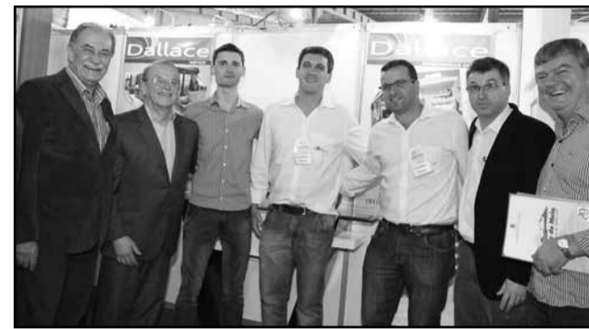
Autoridades presentes no estande da Dalla Móveis