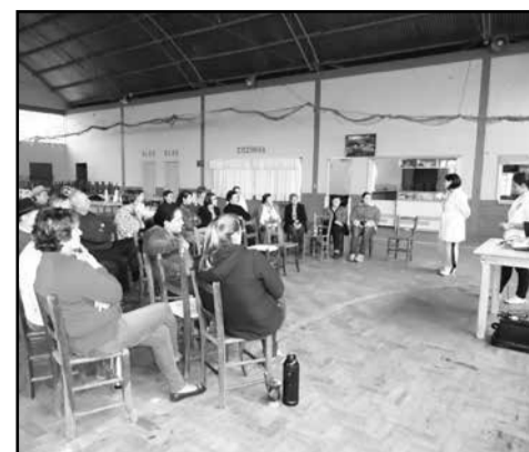
Equipe ESF e participantes

disponibilizaram o espaço Saúde agradece pela participação dos municípios e aos organizadores nas comunidades.