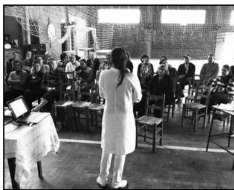
Participantes na comunidade de Salvação, Agentes comunitárias de Saúde, equipe ESF

O dia-a-dia das pessoas é repleto de acontecimentos, muitos imprevistos afetam a saúde das pessoas, seja em casa ou até mesmo fora dela. Pensando nisso, a Secretaria Municipal de Saúde desenvolve um projeto nas comunidades sobre Orientações de primeiros socorros para seus municípios. No dia 23 de abril, Comunidade de Salvação e, no dia 24 foi, Comunidade de Capoeirinhas