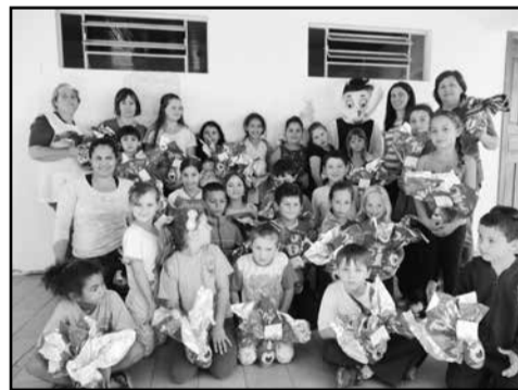
Escola de Salvação