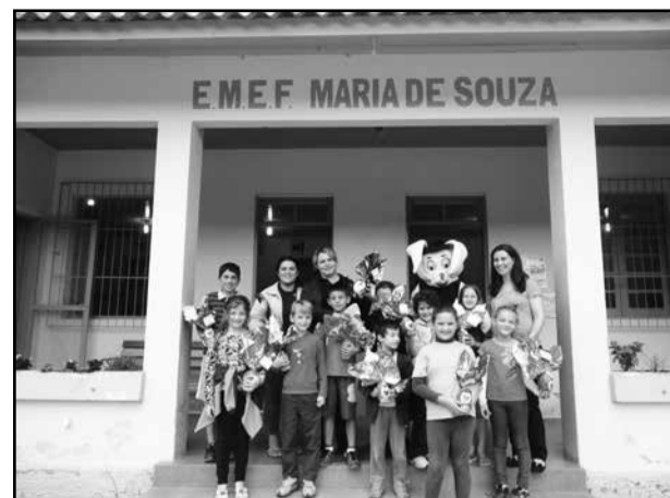
Escola de Cuias

Quando ele apareceu na cerca, as crianças da Escolinha ficaram eufóricas, cantaram e festejaram com o Coelho que não passou da cerca, pois alguma criança poderia se assustar. Assim, abanaram, cantaram, chamaram e insistiram para o Coelho entrar, mas o Fofinho estava muito cansado e não conseguiu pular a cerca.