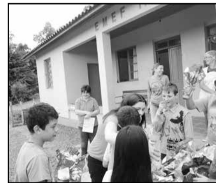
Escola de Capoeirinhas