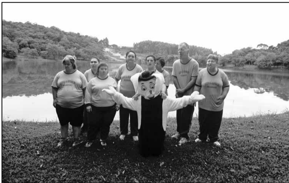
PCD's na Lagoa da Garibaldi, em Encantado