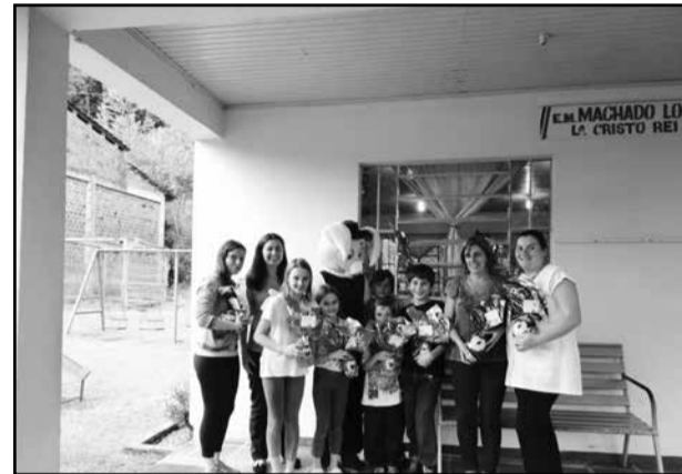
Escola Cristo Rei