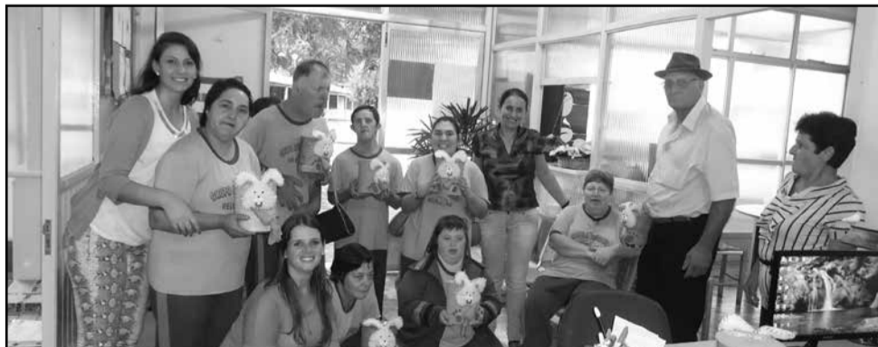
PCD's recebem os ninhos de Páscoa na sede do CRAS