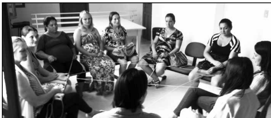
Gestantes e equipe multiprofissional, realizando dinâmica

No mês de abril o encontro se realizou no dia 03. Durante encontro aconteceu uma dinâmica com as gestantes a respeito dos mitos e verdades relacionados a gestação. A equipe ESF comunica que os encontros das gestantes de Relvado acontecem toda primeira quinta-feira do mês, a partir das 13h30min.